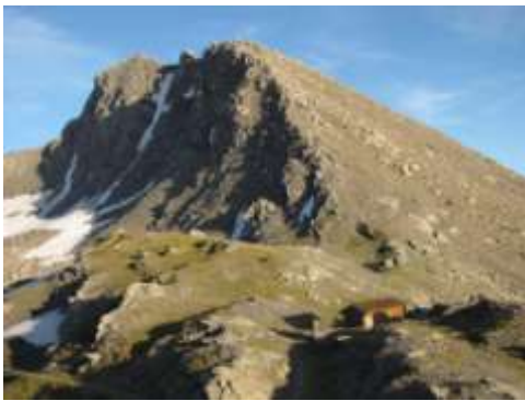
Colle e bivacco Beth col Ghinivert

mezzi propri si raggiunge Pattemouche, borgata di