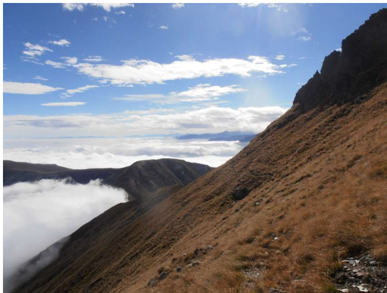
Parte finale del percorso dal Colle della Roussa verso la cima