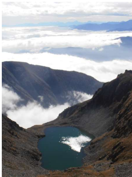
Il lago di Rouen

Discesa nel vallone della Balma costeggiando i laghetti Soprano e Sottano sino a raggiungere il rifugio omonimo. Di qui il sentiero per Case Agostino chiuderà il percorso ad anello riportandoci al punto di partenza.