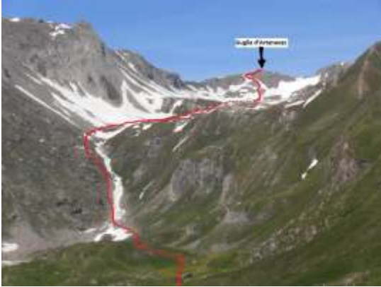
La cima vista da metà salita

Un'escursione dalle due facce: un lungo trasferimento in salita percorrendo la lunga ed erbosa/rocciosa Comba di Planaval, strutturata a balze e pianori, ed un arrivo in cresta dalla quale appare un imponente panorama sull'intero versante italiano del massiccio del Monte Bianco. Un posto in prima fila verso le Grandes Jorasses e il Mont Dolent.