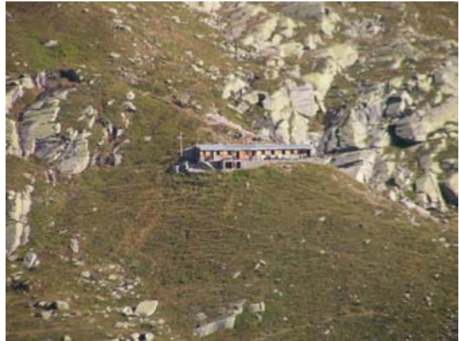
Rifugio Daviso (2280 m)

Proficua escursione che permette di avere una splendida visione di una parte della testata terminale Val Grande: quella del vallone della Gura, che va da Cima Monfret (3373 m) alla Levanna Orientale (3555 m), con spettacolo imponente. Le ardite pareti rocciose, i nevai ed i ghiacciai che scendono dalle Punte Mezenile (3429 m), Martellot (3452 m), Girard (3262 m) e della Levanna Orientale dominano per centinaia di metri d'altezza la via di salita, lasciando senza fiato il visitatore. Il rifugio Daviso (CAI di Venaria), costruito nel 1928, fu travolto da una enorme valanga nel 1932, rifatto, venne nuovamente spazzato via da una valanga nel '34 e fu ancora rimesso in piedi, in un luogo leggermente ad ovest rispetto al sito originario, dove si trova attualmente.