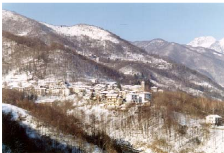
Traves in inverno

anche utilizzate come rifugio dai partigiani durante la guerra di liberazione. Dal colletto è frequente vedere cordate di alpinisti impegnati a scalare le pareti delle Lunelle, una delle prime palestre di roccia del torinese. Particolarmente interessante il colpo d'occhio sul selvaggio Vallone del Rio Ordagna, forse una delle zone più integre delle valli.