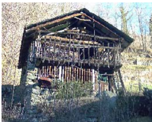
Un caratteristico " benal "