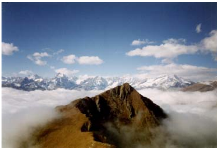
La Bellavarda (2345 m)

Vonzo, l'abitato da cui praticamente ha inizio il vallone, un tempo era comune autonomo mentre ora è una frazione di Chialamberto. Gli abitanti del luogo vivevano isolati per buona parte dell'anno a causa della notevole distanza dal fondovalle. A tale proposito si racconta un simpatico aneddoto: il Conte Francesetti di Mezenile, studioso e storico delle Valli di Lanzo del secolo XIX, si recò, nel 1820, con alcuni aiutanti a Vonzo e raggiunto il paesino impiegò non poco tempo per convincere gli alpigiani che si erano fatti incontro che non era un mercante e che gli strani strumenti che aveva con se non erano in vendita perché non sarebbero serviti loro a nulla, trattandosi di barometri, termometri ed altri strumenti scientifici.