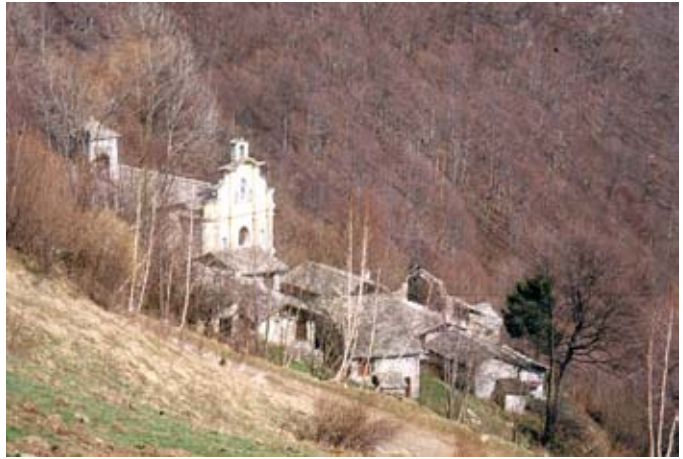
La borgata Marsaglia

La borgata Marsaglia, frazione di Monastero, è posta in un ridente pianoro dominata dalla chiesa con eleganti linee barocche della facciata, contornata da piccole e caratteristiche case in pietra, tipiche dei borghi alpini. La presenza di un edificio così grande e solenne in un borgo scarsamente abitato anche nei secoli passati, è comprensibile solo se lo si individua quale luogo di culto da tempo immemorabile, al crocevia di sentieri che conducevano agli alpeggi: l'ipotesi è avvalorata dal ritrovamento di manufatti in pietra, incisioni rupestri e cavità scavate nella roccia, segni di antichissimi riti.