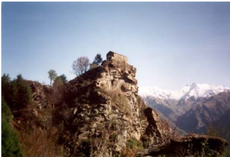
Il Santuario di Santa Cristina

Il sentiero si snoda per intero in un fitto bosco, rendendo fresca e piacevole la salita anche in piena estate. Consigliabile è anche l'autunno per unire al bel panorama che si gode dal santuario il piacere di camminare nel bosco dai colori autunnali.