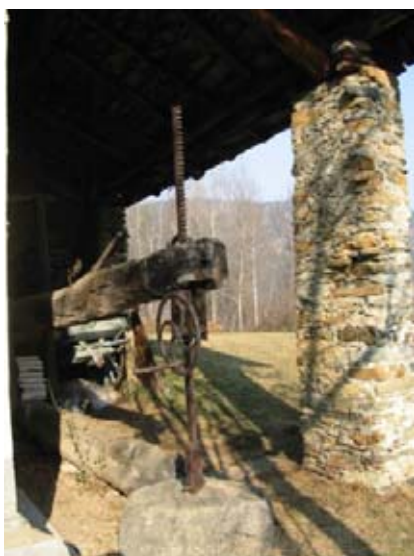
Antico torchio latino a Pian Castagna

"Concessioni" del Marchese di Lanzo, Sigismondo d'Este. In uno dei famosi disegni di Clemente Rovere del 1840, ci viene illustrata la vecchia mulattiera di Viù in ottimo stato, con le pendici del Monte Basso totalmente disboscate per rifornire le numerose fucine della bassa valle. Perse notevole importanza alla fine del 1800 e venne pressoché abbandonata nel 1900, a causa della nuova strada costruita in fondo valle.