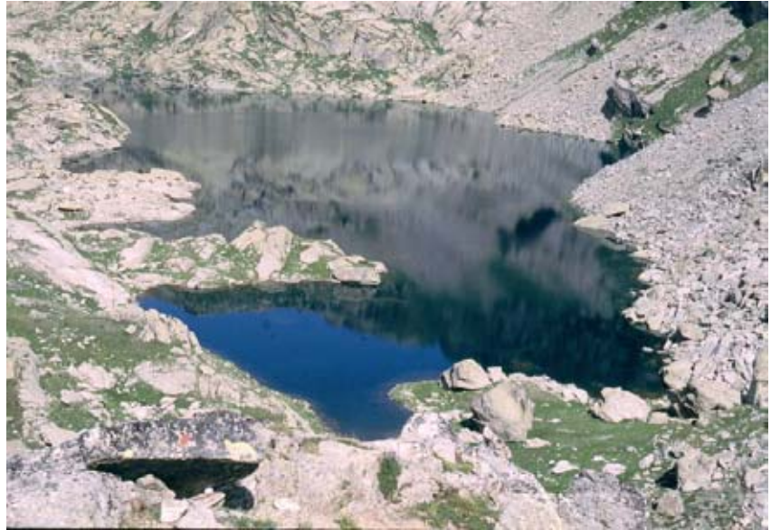
Il Gran Lago di Unghiasse

Uno dei percorsi ad anello più suggestivi e panoramici della Val Grande di Lanzo, alla scoperta della morfologia glaciale pleistocenica, di erosione e di deposito, dei valloni di Vercellina e dell'Unghiasse. Laghi di escavazione, rocce montonate, massi erratici, gradini glaciali e massi erratici, caratterizzeranno il percorso, che prevede anche una breve variante al colle della Crocetta 2641 m, antico e frequentato punto di passaggio tra Valle dell'Orco e la Val