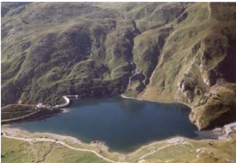
Il lago di Malciaussia

“Il nome Malciaussia vorrebbe significare ‘mal calzata’, a motivo della sua posizione ai piedi dei ghiacciai che la rendono fredda e abitabile poco tempo all’anno, Secondo altri il nome deriverebbe da ‘mal chaussée’, cioè male lastricata ” : così si legge sulla guida del CAI scritta da Martelli e Vaccarone nel 1889.