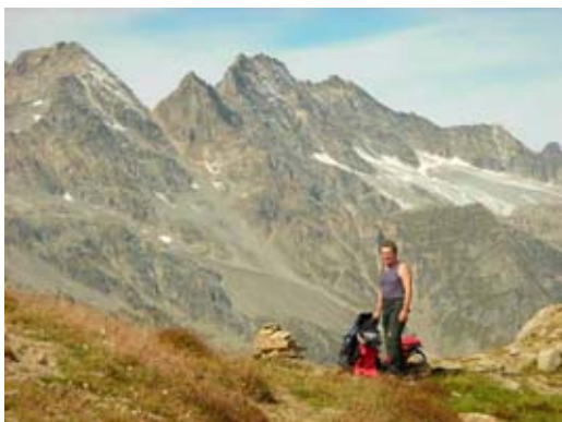
Il Colle della Terra