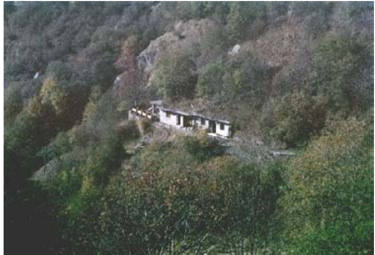
I locali della miniera Brunetta

Nell'impianto lavoravano 12 minatori, che giornalmente salivano a piedi alla cava di Vru; si lavorava tutto l'anno, anche d'inverno salvo in caso di eccezionali neviccate. In ogni caso, per ogni evenienza, nei pressi della cava si trovavano (e si trovano tuttora), alcune baite che servivano in caso di necessità come alloggio per i minatori.