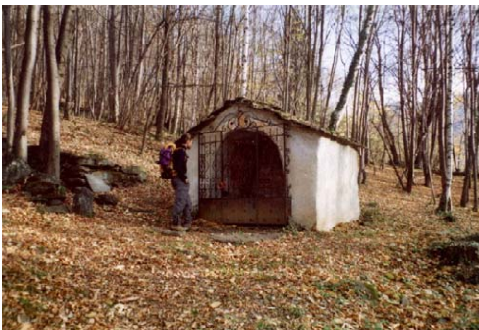
La Cappella degli Appestati