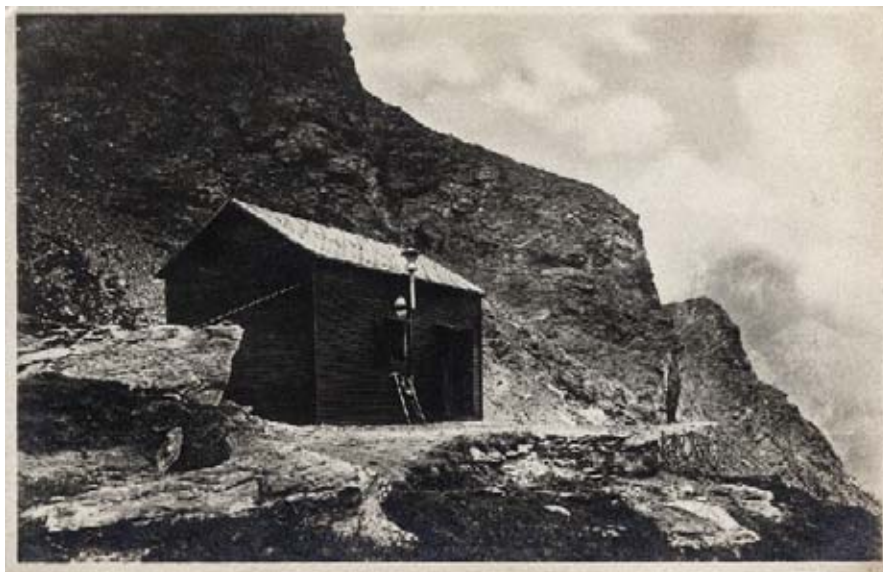
1920 – Il primitivo rifugio Tazzetti

Ma è nella seconda metà dell'ottocento che questa esplorazione si evolve verso ciò che saranno l'escursionismo e l'alpinismo