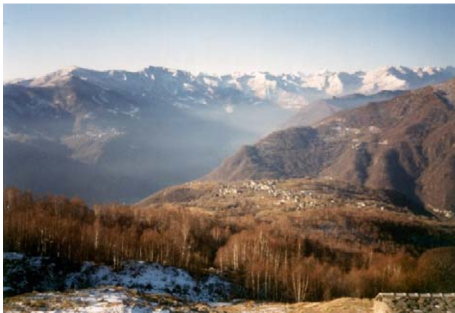
Panorama dal Colle Lunella