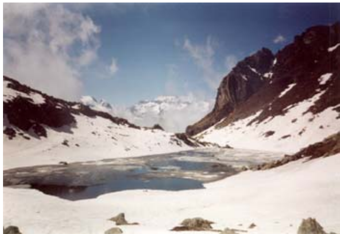
Il lago Vasuero in veste primaverile

La Regione Piemonte, attraverso l'assessorato allo Sviluppo della montagna e foreste, ha assunto l'importante ruolo di coordinare sul territorio italiano la messa in rete dei sentieri di ben 4 regioni (Friuli Venezia Giulia, Lombardia, Valle d'Aosta, oltre ovviamente al Piemonte) e 3 province (Imperia, Trento, Bolzano e Belluno) per realizzare un unico filo conduttore capace di esprimere la bellezza, la forza e le tradizioni di alcune