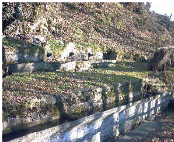
La fontana in pietra