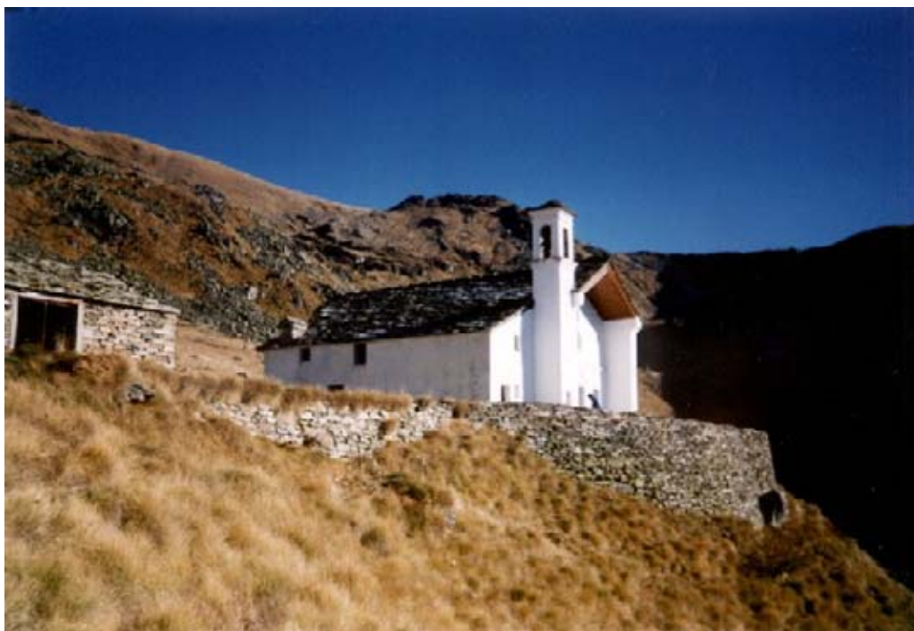
Il Santuario del Ciavanis (1880 m)