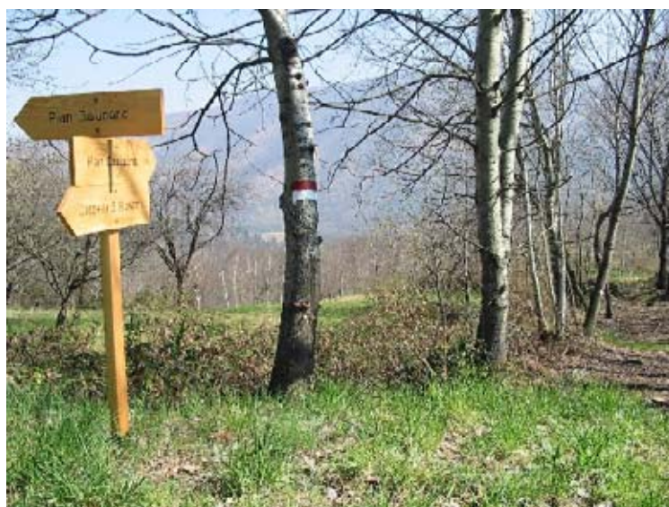
Cartelli indicatori del percorso