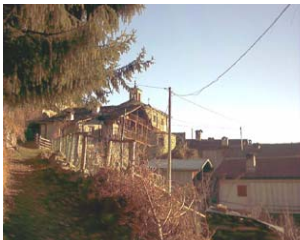
La borgata di Pessinea (1009 m)