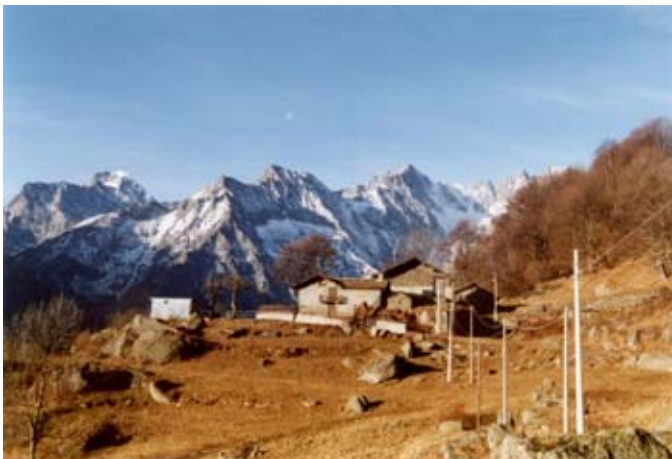
La borgata dei Rivotti

Grande di Lanzo. Panorama grandioso su una buona porzione delle Alpi Graie meridionali e sul gruppo del Gran Paradiso.