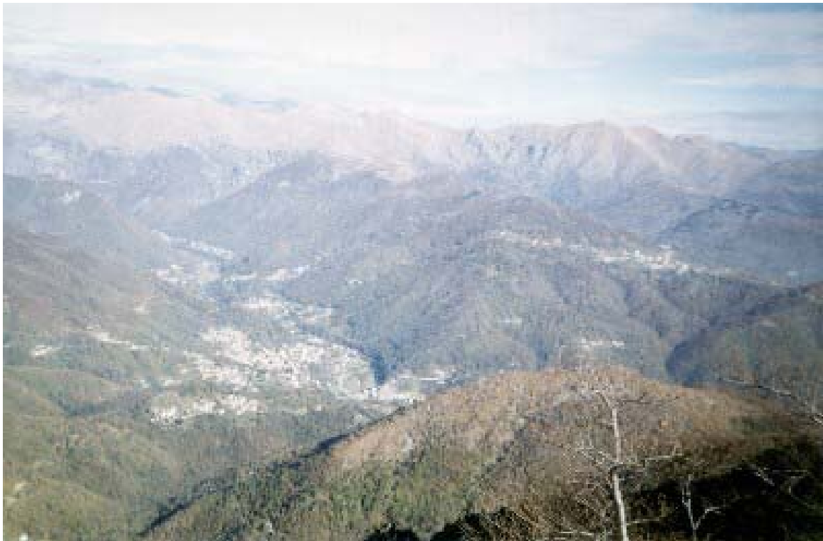
Panorama dal Colle di Prà Lorenzo