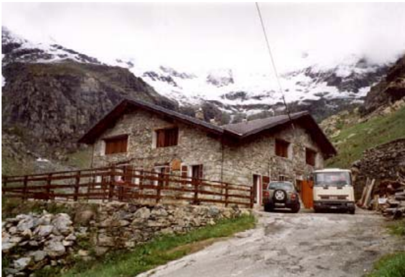
Rifugio Città di Ciriè

Tra le ampie distese di prati e sugli altopiani laterali di Pian Saulera e Pian Ciamarella pascolano a tutt'oggi numerose mandrie di bestiame che consentono di produrre un'eccezionale qualità di formaggio "Toma".