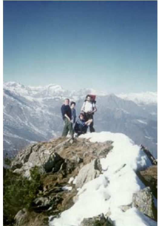
In vetta all'Uja di Calcante

Percorso che offre ampissimi panorami e attraversa una zona di notevole bellezza, ancora molto selvaggia e integra. Pur non elevata, l'Uja di Calcante, il cui nome pare essere di origine celtica, sovrasta diversi paesi e borgate della bassa Valle di Lanzo tra cui Viù, Traves, Pessinetto e Mezzenile. Anche le leggende hanno la loro parte nella storia di questa montagna, infatti un antico detto popolare vuole che Calcante e Pera Cagna valgano più di Francia e Spagna. Lungo le pendici dell'Uja numerose miniere vennero attivate dal XIII al XIX secolo. Si favoleggia di ricche miniere d'oro, ma in realtà si estraeva soprattutto rame. Per concludere bisogna ricordare che l'Uja, con le vicine Lunelle (1494 m), ha una lunga tradizione escursionistica e alpinistica: prima della guerra nelle località vicine operavano addirittura delle guide alpine. Si può dire che le scoscese pareti rocciose di queste montagne siano state tra le prime palestre di roccia degli alpinisti torinesi.