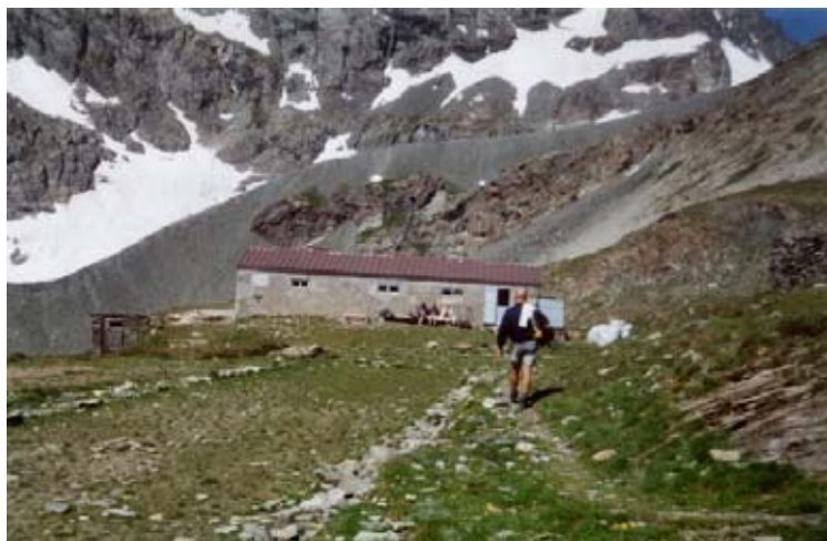
Il vecchio rifugio Gastaldi

Il concetto di rifugio alpino nasce nel momento stesso in cui l'uomo vede nella conquista delle vette un'attività degna di nota, ammantata di spirito di conquista e di ricerca scientifica. Siamo tra la fine del XVIII secolo e l'inizio del XIX. Gli alpinisti, accompagnati da lunghe carovane di portatori e dalle prime improvvisate guide, partono all'attacco dei colossi alpini. Ma i villaggi sorgono, in genere, laggiù nel fondovalle e ben presto ci si rende conto che, per quanto ci si alzi a ore antelucane, è impossibile giungere in quota nelle prime ore del mattino che garantiscono una relativa sicurezza.