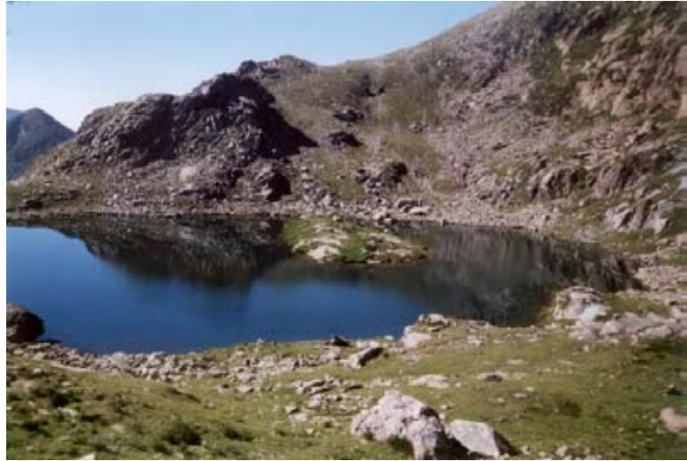
Il Lago di Viana (2206 m)

Oggi giorno questa soleggiata e fertile zona presenta l'estinzione quasi totale delle tradizionali attività montanare; di conseguenza numerose grangie sono abbandonate e crollanti, i bellissimi prati sono infestati da piantine neonate che presto diventeranno boscaglia... Un quadro desolante, che dà scoramento.