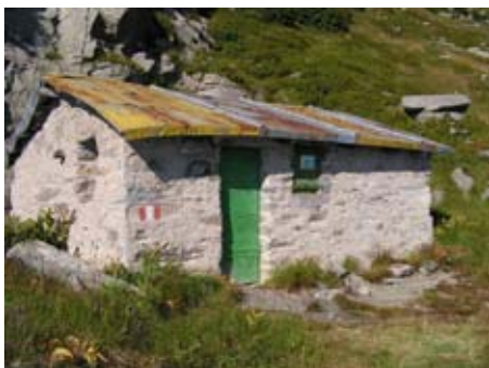
Rifugio Ferreri (2207 m)

La popolazione, da un censimento fatto nel XIV secolo, ammontava a circa 150 persone. In seguito qui, come d'altra parte in tutte le valli, l'attività mineraria andò diminuendo fino a scomparire a cavallo tra il '700 e l'800. Lasciati i minerali e le attività ad essi legate, Forno rinacque grazie al turismo e nell'800 sorsero numerose ville ed alberghi che ospitavano turisti, studiosi e alpinisti. In seguito, lentamente ma inesorabilmente, il paese seguì la sorte di tutti i borghi alpini, denunciando un progressivo spopolamento. I pendii circostanti il paese appaiono ora brulli mentre un tempo invece erano ricoperti da enormi foreste, dove gli scoiattoli potevano effettuare lunghi percorsi senza scendere mai a terra. Lo scriteriato disboscamento è stato origine di numerose valanghe e frane, alcune delle quali disastrose. A proposito di frane si può parlare di quella del 24 settembre 1993: dopo alcuni giorni di pioggia torrenziale anche in alta quota, una morena del Ghiacciaio del Mulinet che sovrasta il vallone della Gura ha ceduto sotto la pressione dell'acqua accumulatasi ed