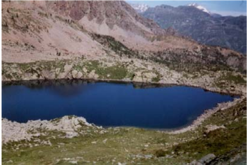
Il lago di Lusignetto

Il rifugio agriturismo Longimala, che si trova nella parte bassa del vallone del rio Busera, è stato ricavato da un vecchio alpeggio brillantemente ristrutturato ed è un punto di riferimento importante in quanto da lì partono numerosi sentieri diretti ad interessanti località della zona.