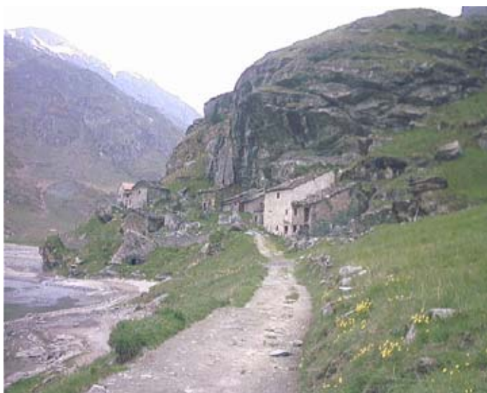
Le Grangie di Pietramorta nei pressi del lago

Per l'escursionista è forse l'itinerario più facile con partenza da Malciaussia: si tratta di una passeggiata panoramica, su pendio aperto, che permette una visione completa del bacino e delle cime circostanti.