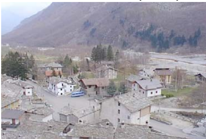
L'abitato di Forno Alpi Graie

delle aree montane più affascinanti del mondo, dalle Dolomiti ai giganti delle Alpi Occidentali.