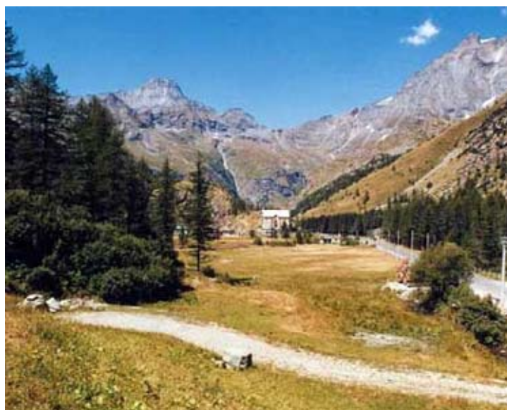
Il Pian della Mussa con la Bessanese sullo sfondo