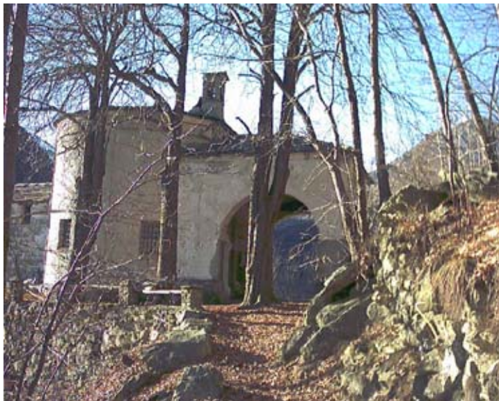
La Capella della Consolata (961 m)

Pessinea è una suggestiva frazione che merita certamente una visita. Vi esistono ancora le strutture di alcuni " benal " (fienili) che fino a qualche decennio fa venivano coperti con tetti di paglia di segale. Dal centro della borgata con una breve passeggiata di pochi minuti si può raggiungere una bella fontana in pietra, datata 1880, con quattro getti e un rosone centrale in pietra scolpita. Con altri 10 minuti di cammino si può raggiungere la Cappella della Madonna della Consolata o Cappella del Tuc posta su uno sperone roccioso da cui si gode un'ottima vista panoramica sulla vallata.