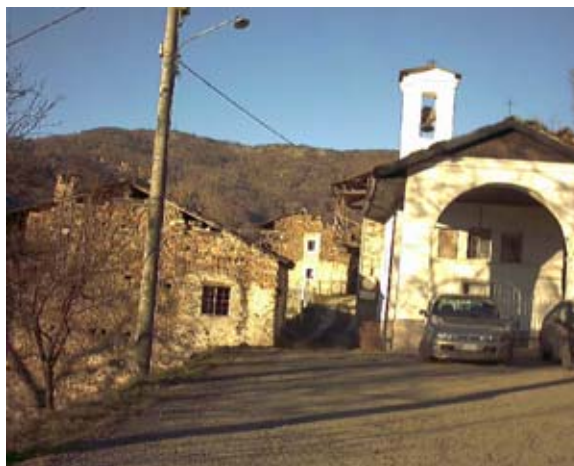
La frazione Castagno