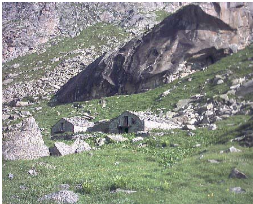
Il Gias Nuovo nel Vallone di Sea

Nel secondo dopoguerra assistiamo ad una nuova rivoluzione: l'alpinismo classico, quello che, come diceva Rey, "... credeva nella lotta con l'Alpe..." gradatamente fu sostituito da nuove forme, quali l'arrampicata sportiva, ma soprattutto dalla riscoperta del puro piacere di camminare. E gli escursionisti chiesero sempre più rifugi comodi e spaziosi, le famigliole camerette a 4/6 posti, docce ed una cucina più curata.