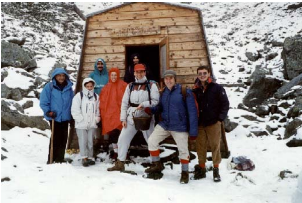
Il Bivacco Gandolfo (2301 m)

aspetti tipici dell'architettura di montagna. L'escursione ai Laghi Verdi, per via del facile accesso e per la bellezza del luogo, costituisce una delle gite più frequentate della valle. Nel vallone di Paschiet, che si deve risalire per giungere all'omonimo lago, non è raro avvistare camosci al pascolo. A monte dei Laghi Verdi si trova il Bivacco Gandolfo (2200 m), posto all'ombra della Torre d'Ovarda (3075 m).