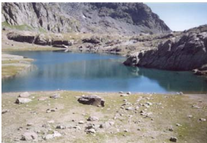
Lago di Peraciaval

Si tratta di una escursione piuttosto lunga ma molto interessante. Durante la salita, ad esempio, si incrocia il vecchio tracciato della ferrovia a scartamento ridotto che, negli anni '30, collegava i cantieri del Lago Dietro la Torre e del Lago di Malciaussia. Nella primissima parte della salita si può godere di un buon panorama dell'alta Val di Viù e sullo spartiacque Val di Susa - Val di Viù mentre in seguito si ammirano le cime che fanno da corona al Vallone d'Arnas ed al Pian Sabiunin, dove si trova il Rifugio Cibrario.