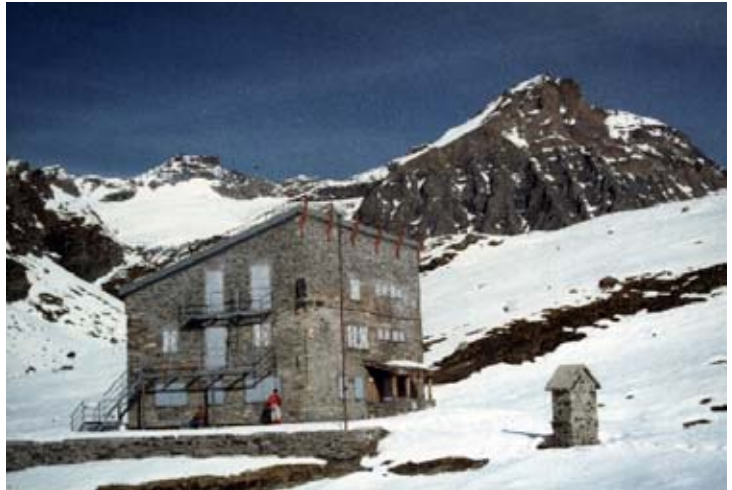
Rifugio Gastaldi (2659 m)

Il Collarin è un piccolo laghetto posto in una conca rocciosa, sotto la Punta Maria. Visto la quota è sovente ghiacciato. Anche se pochi vi si fermano il lago è molto frequentato poiché si trova lungo il sentiero che collega il Rifugio Gastaldi al Lago della Rossa, una delle escursioni più note delle Valli di Lanzo