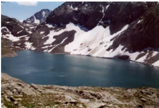
Lago della Rossa (2718 m)