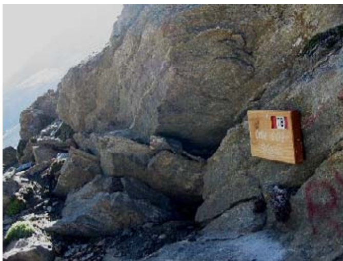
Il Col Sulé (3073 m)

Un po' retorico? Eppure sino a qualche tempo fa questa era l'immagine del rifugio alpino. Forse già non più rispondente alla realtà, ma ammantata da un fascino antico, intriso dello spirito originario dell'alpinismo classico e di una spruzzata di nazionalismo che voleva il rifugio "sicura vedetta ai patri confini".