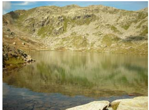
Il Lago della Fertà