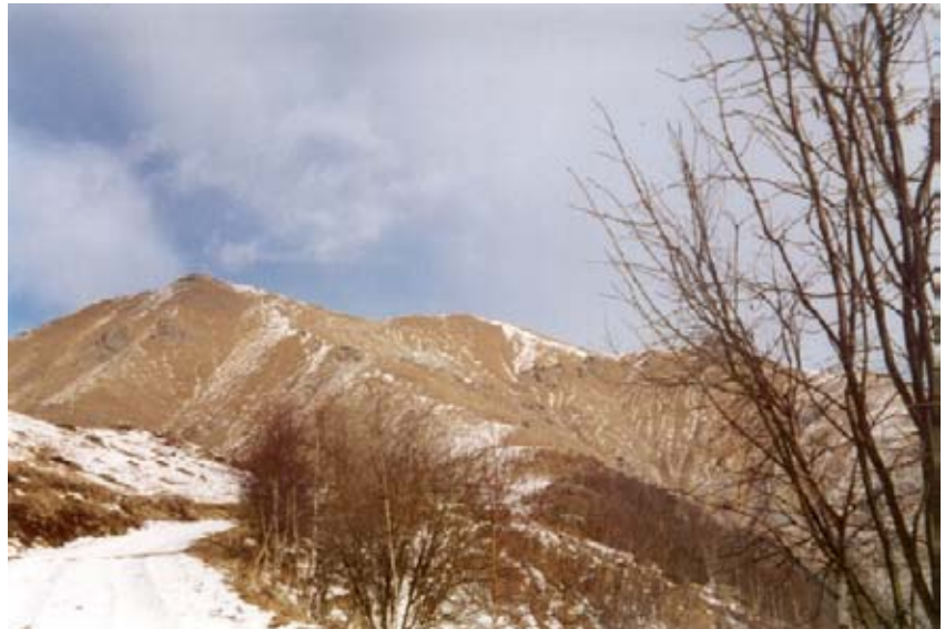
La Vaccarezza (a sinistra) e l'Angiolino (in centro) visti dall'alpeggio La Cialma

La Vaccarezza, o Castel Balanger, con ha la vetta caratterizzata da un grosso ometto di pietre, e l'Angiolino sono ben visibili anche dalla pianura. Eccezionale il panorama dagli Appennini alle Alpi Marittime per proseguire con il Monviso, le Cozie e tutte le più note montagne delle Valli di Lanzo, si continua con il gruppo del Gran Paradiso ed, in lontananza, il gruppo del Rosa. Nelle giornate particolarmente limpide appaiono anche a nord-est le montagne lombarde del Bernina e dell'Adamello. Se possibile è consigliabile l'attesa del tramonto: l'immensità del panorama che si tinge prima di rosa e poi di rosso sempre più acceso colpisce l'animo aprendolo a emozioni indimenticabili. Anche sulle pendici di questa montagna si trovano numerosi alpeggi e molti altri se ne vedono sulle montagne vicine, che ricordano gli stenti che i vecchi montanari dovevano sopportare per strappare a questi pascoli, non molto ricchi, il necessario per vivere con le proprie famiglie ed i propri greggi.