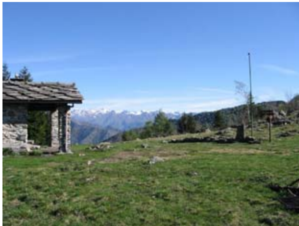
Il Colle della Portia (1328 m)

pensare che già in un documento di donazione datato 1011 questi luoghi venivano citati dal Vescovo di Torino Landolfo. Il borgo di Richiaglio è oggi pressoché abbandonato con molte abitazioni, tra cui la chiesa, ormai in rovina. Un tempo invece era un popoloso paesino, frazione del comune di Col San Giovanni. Tutto passò sotto la giurisdizione del comune di Viù nel periodo fascista. Gli abitanti di Richiaglio, come quelli delle altre borgate vicine, erano famosi per la bravura nel fabbricare gerle e canestri, i garbin, ma questa antica attività purtroppo rimane solo più viva nei ricordi dei vecchi della zona. Anche il Colle Lunella era anticamente molto frequentato poiché metteva in comunicazione la bassa Val di Viù con Val della Torre. Le cronache di inizio '900 raccontano di una tragedia avvenuta nei pressi del valico. Un gruppo di valligiani di ritorno da Val della Torre volle tentare di superare il passo di notte, in inverno ed in mezzo all'infuriare della bufera, per tornare il più velocemente possibile a casa. Durante il tentativo un giovane del paesino di Richiaglio perse la vita: stremato dalla fatica cadde nella neve e fu sepolto. Il corpo venne ritrovato soltanto dieci giorni dopo, nonostante i disperati soccorsi portati dai compaesani.