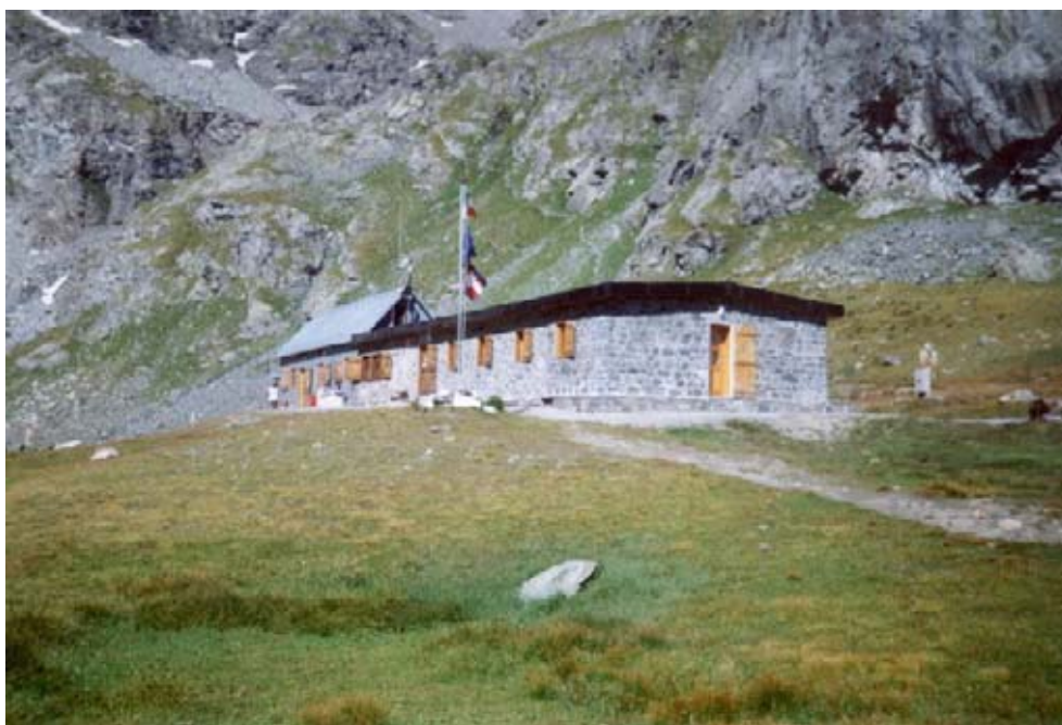
Il Rifugio Cibrario

cittadino di Usseglio e uno dei primi presidenti del CAI Torino. Dopo aver subito più volte ristrutturazioni e ampliamenti, il rifugio venne affidato alla sezione CAI di Leini a partire dal 1976. Questo rifugio è utilizzato per le ascensioni alle numerose e interessanti vette della zona, su tutte la Croce Rossa 3566 m), o per le traversate al Rifugio Averole in Francia. La parte centrale del sentiero che accede al rifugio è, purtroppo, in alcuni punti ostacolata dalla vegetazione invadente mentre in basso si può assistere allo scempio ai danni del vallone d'Arnas provocato dalla costruzione di una strada.