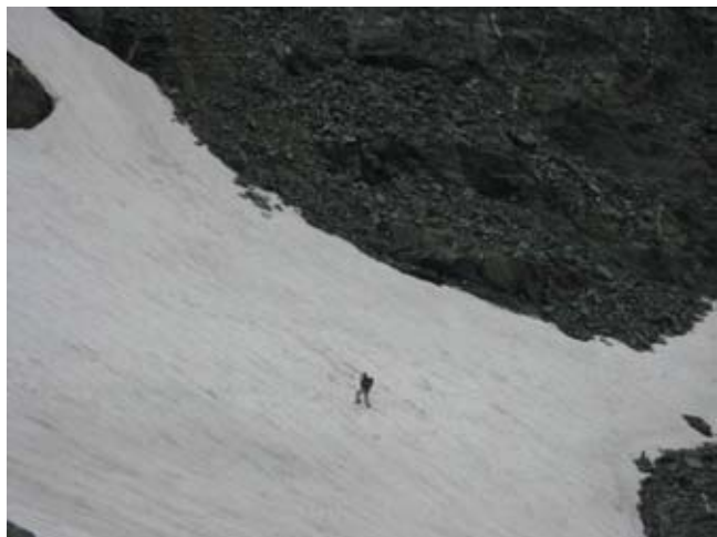
Verso il Passo del Collerin

I rifugi di partenza sono raggiungibili dal versante francese (Ref. d'Averole) dal comune di Bessans/Averole (Haute Maurienne) e da quello italiano rispettivamente dal comune di Balme/Pian della Mussa (Rif. Gastaldi) e Usseglio (rif.Cibrario); questi ultimi entrambi nelle valli di Lanzo a circa 50 Km da Torino