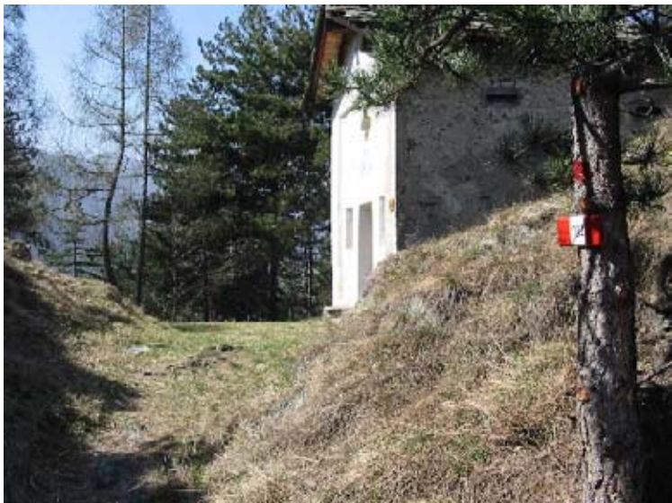
Cappella di San Giovanni

Questa via di comunicazione venne sempre sfruttata dai valligiani, ma si cercò di utilizzarla più convenientemente nel 1500 e poi nel 1600, realizzando una nuova mulattiera. Nel 1378 venne costruito il Ponte del Diavolo e per ammortizzare le spese venne posto un "dazio" per il passaggio in Lanzo verso le Valli e per obbligare l'attraversamento del paese. In vecchio sentiero, che permetteva di entrare nelle valli senza percorrere il Ponte del Diavolo, venne demolito in seguito a due ordinanze della Credenza di Lanzo (l'attuale Consiglio Comunale): il 10 gennaio 1556 e il 27 aprile 1557 e si impose, per il passaggio, una ammenda di 100 ducatonì.