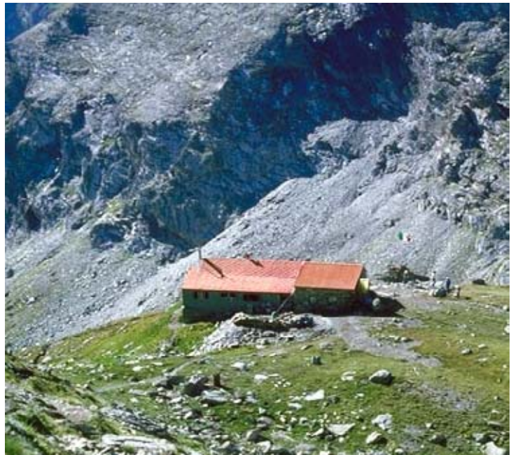
Il Rifugio Tazzetti (2642 m)

Comoda escursione su sentiero battuto e ben segnalato che raggiunge la più conosciuta base di partenza, dalla Valle di Viù, verso il Rocciamelone (3538 m); vetta "popolare", celebre e molto ambita, dai piemontesi specialmente. Il rifugio sorge su un ripianetto soleggiato, proprio di fronte al severo e scosceso versante NE del Rocciamelone che piomba, con 750 metri di dislivello, nella vasta conca di macerie, nevai e laghetti, che si estende oltre il rifugio, chiamata Fons d'Rumour ("Fondi del Rumore"). Il rifugio venne costruito nel 1913 dalla sezione CAI di Torino e successivamente ampliato nel 1933; il suo nome ricorda un alpinista tragicamente perito sulla Torre d'Ovarda (3075 m). La gestione è affidata al CAI di Chieri, può ospitare cinquanta persone ed è aperto per tutta la settimana tra la metà di luglio e la fine di agosto, mentre il sabato e la domenica da metà giugno a fine settembre. Soffocato dalla cresta retrostante, e con l'orizzonte bloccato dalla dirimpettaia costiera delle Rocce Rosse, il rifugio gode ancora di buoni squarci panoramici sulla Punta Sulé (3384 m), sul Lago di Malciaussia e sulla Valle di Viù che si vede d'infilata.