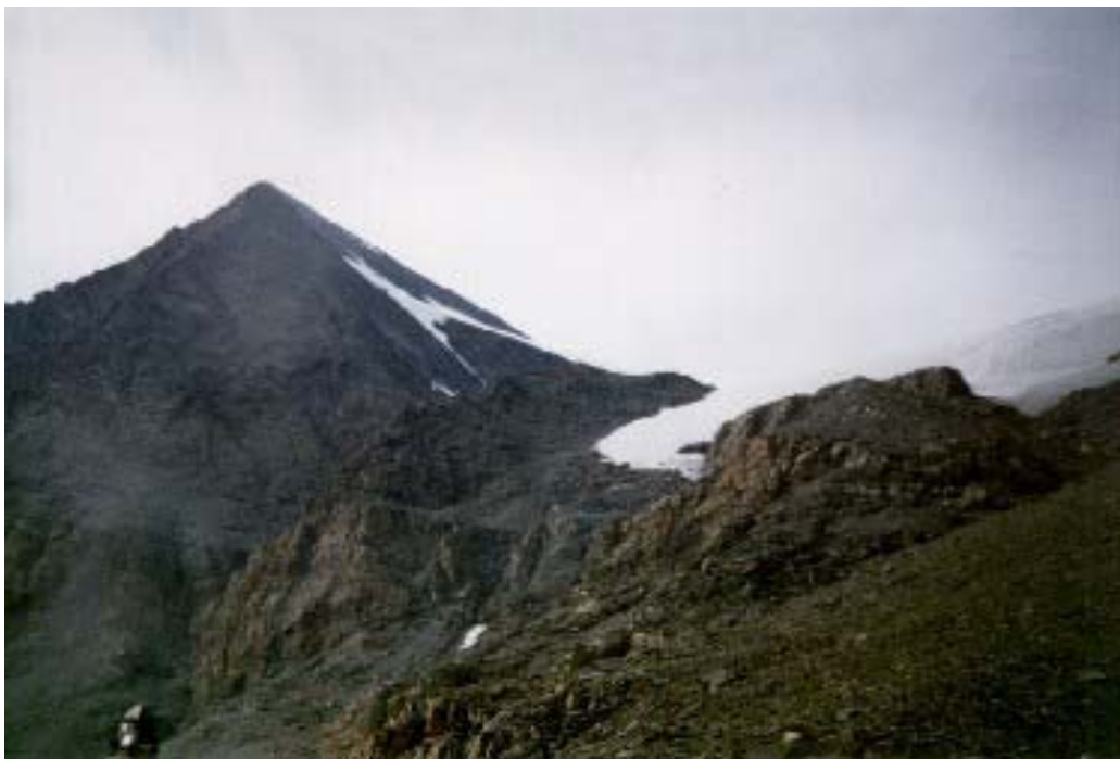
Il Rocciamelone (3538 m)