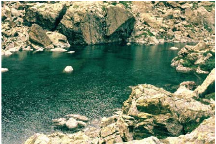
Lago Verde Superiore (2154 m)

Non è solo la bellezza dell'ambiente l'aspetto interessante di questa escursione. Le frazioni Cornetti e Frè sono infatti sorte come centri minerari e solo in un secondo tempo divennero tipici abitati di montagna con gli abitanti dediti alle attività tradizionali di allevamento ed agricoltura. Queste borgate potrebbero essere sorte nel secolo XIII ad opera di famiglie bergamasche, venute in valle per lavorare nell'allora fiorente attività mineraria. Entrambe le frazioni conservano interessanti