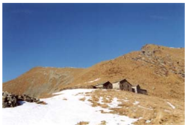
Alpe Frigerola (1791 m)