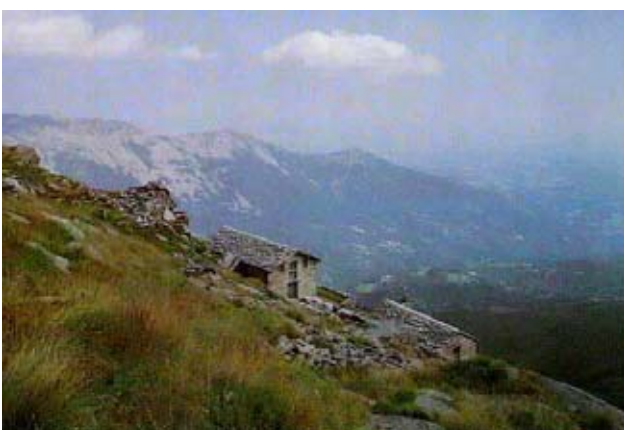
Rifugio Peretti Griva (1820 m)