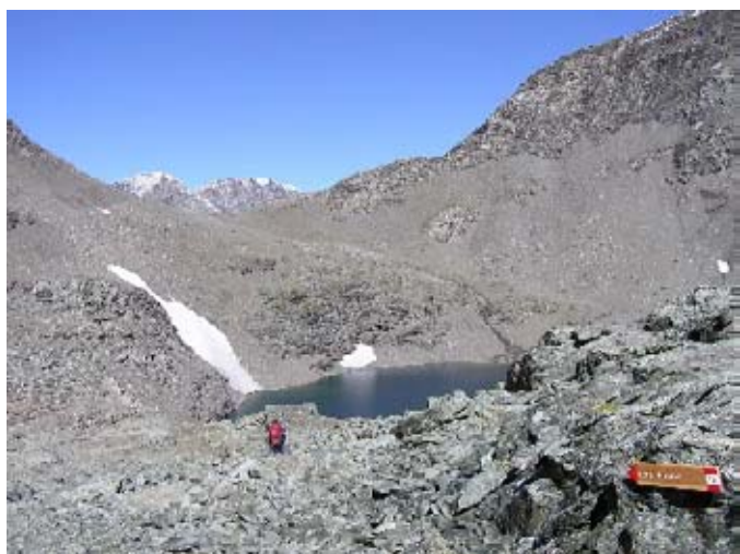
Uno dei laghi d'Autaret