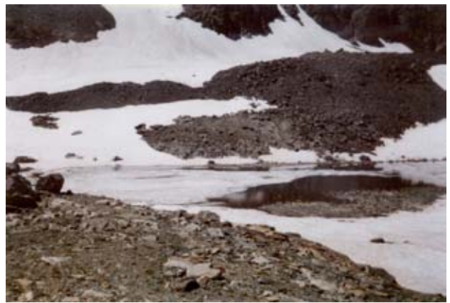
Lago Collarin (2839 m)