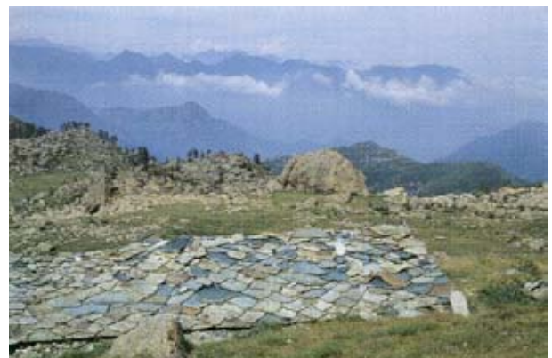
Il caratteristico tetto in lose dell'Alpe Radis