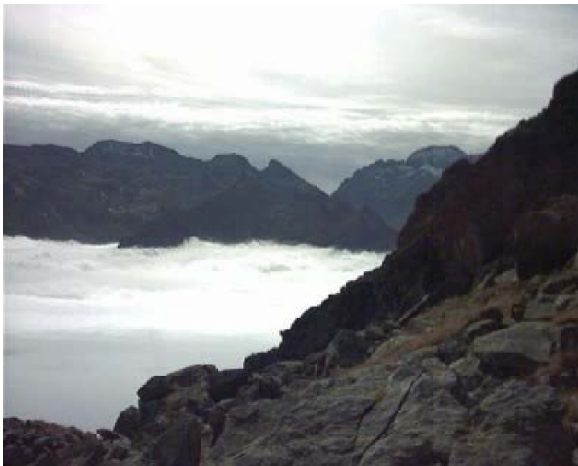
Vista di un mare di nubi dal bivacco