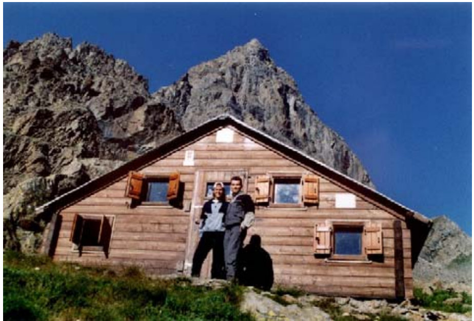
Il Bivacco Molino (2280 m)

Realizzato dalla Sezione di Lanzo del CAI nel 1987 come punto di appoggio per le scuole di alpinismo, è dedicato alla guida Bruno Molino che fu l'apprezzato capo del Soccorso Alpino di Balme.